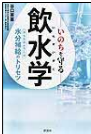
[いのちを守る 飲水学] 谷口 英喜/著