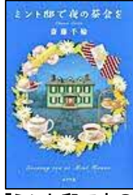
[ミント邸で夜の 茶会を] 斎藤 千輪/著