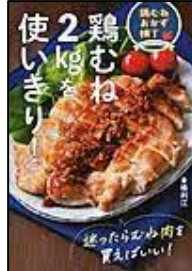
[鶏むね2kgを 使いきり!] 倉橋 利江/著