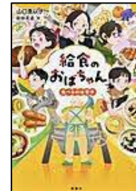
[給食のおばちゃん] 山口 恵以子/作