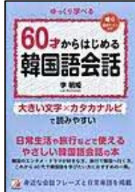
[60才からはじめる 韓国語会話] 李 明姫/著