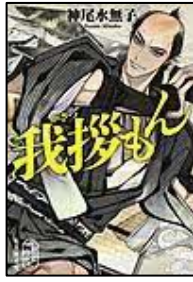
[我撈もん] 神尾 水無子/ 著