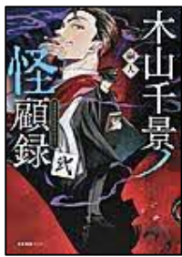
[木山千景ノ 怪願録 2] 嗣人/著