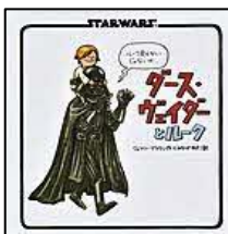
[ダース・ヴェイダー とルーク] ジェフリー・ ブラウン/作