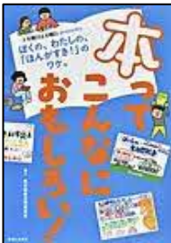
[本ってこんなに おもしろい!] 主婦と生活社/編