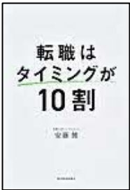
[転職はタイミング が10割] 安藤 健/著