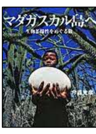
[マダガスカル島へ] 今森 光彦/著