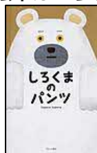
〔しらくまのパンツ〕 tupera tupera／作