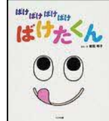
〔ばけたくん〕 岩田 明子 ／ぶん・え