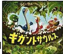
〔ギガントサウルス〕 ジョニー・ダドル／作