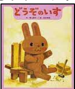
〔どうぞのいす〕 香山 美子／作