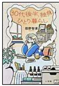
〔30代後半、独身、ひとり暮らし〕 畑野 智美／著