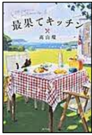
〔最果てキッチン〕 高山 環／著