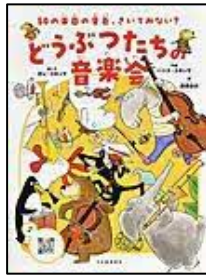
〔どうぶつたちの音楽会〕 オレ・コネツケ／絵と文