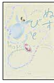
〔ぬすびと〕 寺地 はるな／著