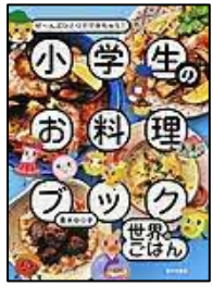
〔小学生のお料理ブック〕 青木 ゆり子／著