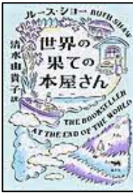
〔世界の果ての本屋さん〕 ルース・ショー／編