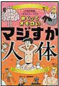
〔めくってオモロいマジすか人体〕 坂井 建雄／監修