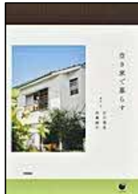
〔空き家で暮らす〕 石川 理恵／取材・文