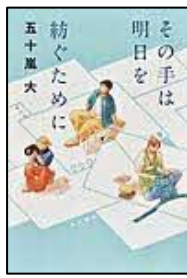
〔その手は明日を紡ぐために〕 五十嵐 大／著