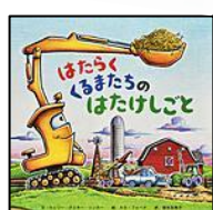
【はたらくくるまたちの はたけしごと】