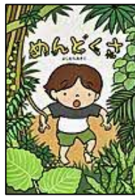
〔めんどくさ〕 よしむら あきこ／作・絵・デザイン