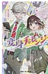
〔#変身チャレンジ!〕 宮下恵菜／作