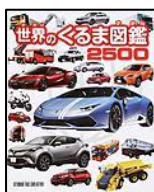
【世界のくるま図鑑 2500】