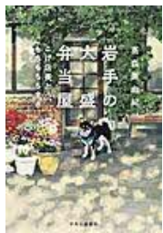
〔岩手の大盛弁当屋 二げ店長ともちもち ちまき〕 高森美由紀／著