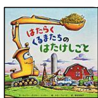
【はたらくくるまたちのはたけしごと】