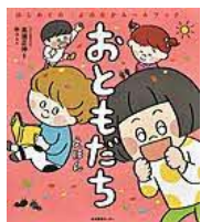
〔おともだちえほん〕 高濱正伸／監修