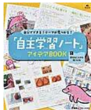
〔「自主学习ノート」 アイデアBOOK1〕 伊垣尚人／監修