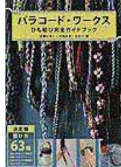
〔パラコード・ワークス〕 辻岡 ピギー／著