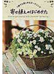
〔寄せ植えのはじめかた〕 主婦の友社／編