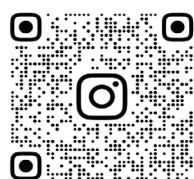
▲ Instagram QR