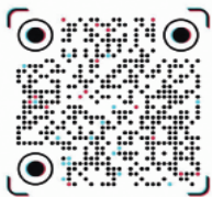
▲ Tik Tok QR

久しぶりに参加してくださった方の笑顔も見られ、とても嬉しく感じました。雪解けとともに、さらに多くの方にご参加いただけることを楽しみにしています。