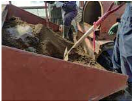
▲ビート土合わせ作業

今年の農作業は事前準備した上で、最大限に出せる力を出して、結果を残し、新規就農できるように突っ走っていききたいと思えます。今後も日々の活動を精一杯尽力いたしますので、どうぞよろしくお願いたします。