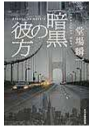
〔暗黒の彼方〕 堂場 瞬一／著