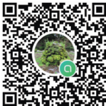
▲LINE オープンチャット (匿名で参加できる グループLINEです。 もうすぐ100人達成!!)

この会での説明や対話を経て、今後は「京極 blue print（ブループリント）」として、月2回程度のペースで定期的に意見交換ができる場を設けることになりました。一方的な提案ではなく、町の皆さんの声をもとに、デジタルの利便性と対話の温かさを大切に、より良い青写真を共に描いていきたいと考えております。一歩ずつ進めてまいります。