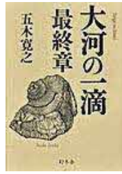
〔大河の一滴 最終章〕 五木 寛之／著