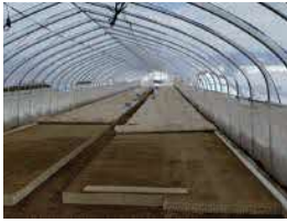
▲ビート種まき作業