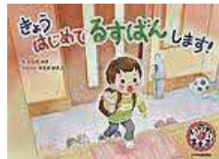
〔きょうはじめてるすぱんします!〕 いしだ 未紗／絵