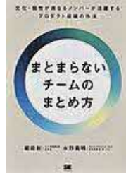
〔まとまらないチームのまとめ方〕 堀田 創／著