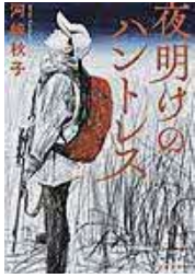
〔夜明けのハントレス〕 河崎 秋子／著