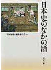
〔日本史のなかの酒〕 『日本歴史』編集委員会／編