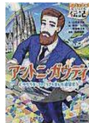
〔アントニ・ガウディ〕 山本 まさみ／文