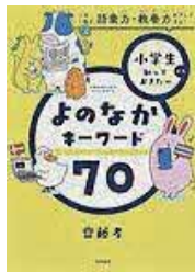
〔小学生から知っておきたいよのなかキーワード70〕 齋藤 孝／著