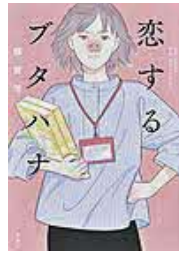
〔恋するブタハナ〕 額賀 滯／著