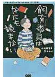
〔飼育委員はなにも読まない〕 小松原 宏子／作