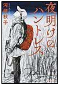
【夜明けのハントレス】 河崎 秋子／著