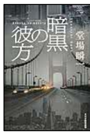
【暗黒の彼方】 堂場 瞬一／著