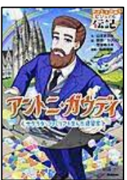
【アントニ・ガウディ】 山本 まさみ／文