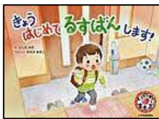
【きょうはじめてるすばんします!】 いしだ 未紗／絵