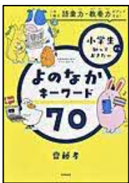
【小学生から知っておきたいよのなかキーワード70】 齋藤 孝／著