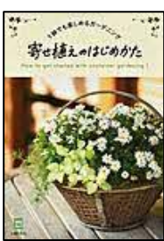
【寄せ植えのはじめかた】 主婦の友社／編