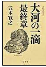
【大河の一滴 最終章】 五木 寛之／著