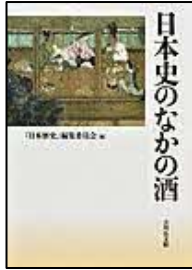
【日本史のなかの酒】 『日本歴史』編集委員会／編