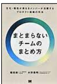
【まとまらないチームのまとめ方】 堀田 創／著