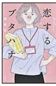
【恋するブタハナ】 額賀 滯／著