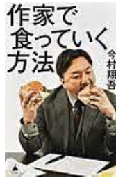
〔作家で 食っていく方法〕 今村翔吾／著