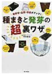
〔種まきと発芽の 超裏ワザ〕 竹内孝功／著