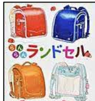
【らんらんランドセル】 モリナガ ヨウ／著