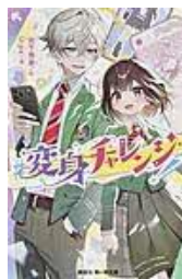
〔#変身チャレンジ!〕 宮下恵菜／作