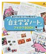
〔「自主学习ノート」 アイデアBOOK1〕 伊垣尚人／監修