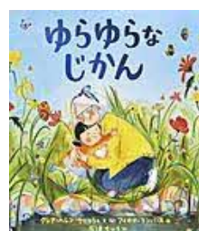
〔ゆらゆらなじかん〕 フィオナ・ランバース／絵