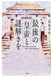
〔最後の皇帝と 謎解きを〕 犬丸幸平／著