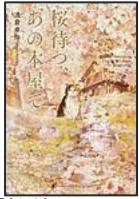
【桜待つ、あの本屋で】 浅倉 卓弥／著