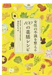
〔女性の不調を整える 100の薬膳レシピ〕 谷口ももよ／著