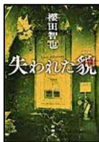
【失われた貌】 櫻田 智也／著