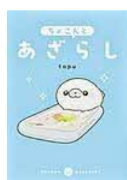
〔ちょこんとあざらし〕 tapu／著