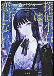
【探偵小石は恋しない】 森 バジル／著

4月9日に2026年本屋大賞が決定します!! 全国の書店員さんの投票で決まるこの賞の受賞作・ノミネート作は映画化されることも多く、湧学館でも利用の多い本ばかりです。 ノミネート作品の中から4作品をご紹介します。