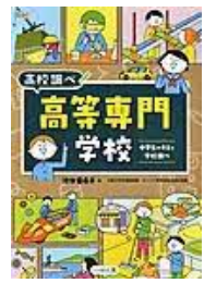
〔高等専門学校〕 池田亜希子／著