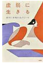
〔虚弱に生きる〕 絶対に終電を 逃さない女／著