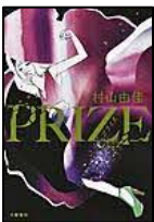
【PRIZE】 村山 由佳／著

ミステリオタクの探偵・小石は、名探偵のように華麗に事件を解決する日を夢見ているが、事務所へ届く依頼は9割9分が色恋調査。ところが事件は、思いもよらないところで発生して…。