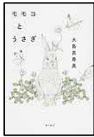
【モモコとうさぎ】 大島 真寿美／著