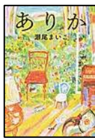
【ありが】 瀬尾 まいこ／著