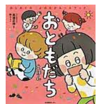
〔おともだちえほん〕 高濱正伸／監修