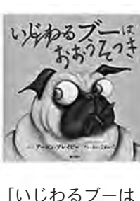
〔いじわるブーはおもうつき〕 アーロン・ブレイビー