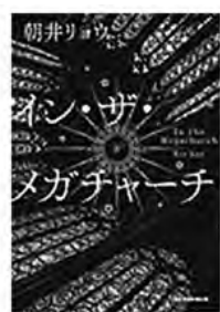
〔イン・ザ・メガチャーチ〕 朝井リョウ／著