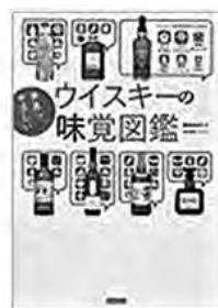
〔ウイスキーの味覚図鑑〕 朝倉あさげ／著