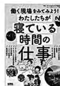
〔わたしたちが寝ている時間の仕事〕