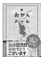
[おかんメール リターンズ] 『おかんメール』制作 委員会/編