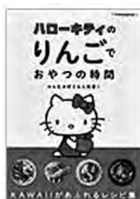
〔ハローキティのりんごでおやつ時間〕 着付け100のコツ すなお／著