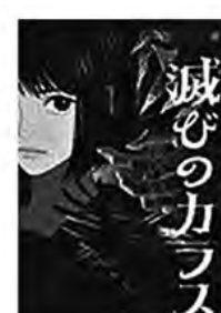
〔滅びのカラス〕 櫻 いいよ／著