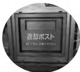
返却ポスト (正面玄関の左側)

蔵書点検とは…湧学館の本がちゃんと館内にあるかどうか、分類のとおりになっているかなど1冊ずつバーコードを読み取ってチェックします。