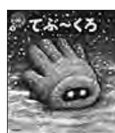
[てぶ〜くろ] ガタロー☆マン/作