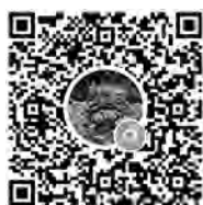
▲LINEオープンチャット (匿名で参加できる グループLINEです)

皆さまの参加を心待ちにしています。困りごとやアイデアも、発言することで解決してくれる人が見つかるかもしれません。