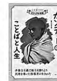
〔ガンディーのことばと人生〕