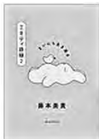
〔ミキティ語録 2〕 藤本 美貴／著