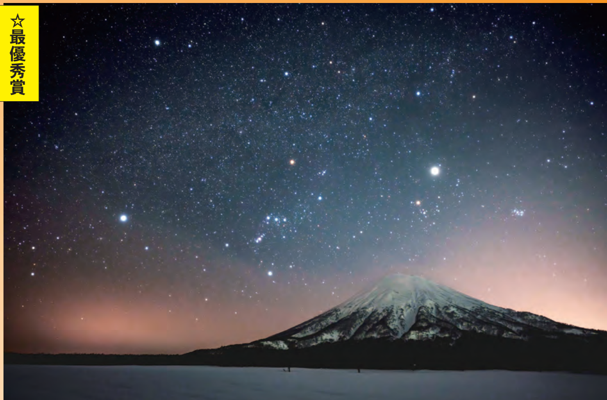
作品名：冬の星空と羊蹄山 氏 名：西井 俊貴