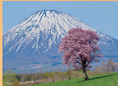
作品名：蝦夷富士と一本桜 氏 名：伊藤 順之