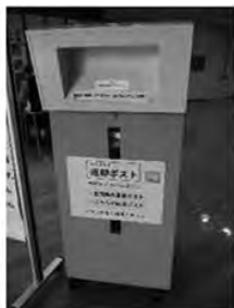
図書室正面 (シャッター前)