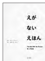
[えが ない えほん] B.J.ノヴァク/さく