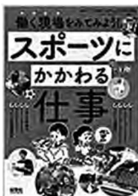
〔スポーツにかかわる仕事〕