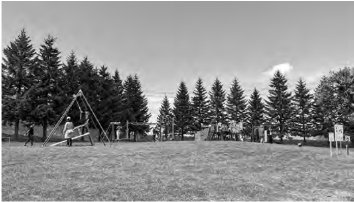
ふきだし公園遊具

るため、まずは新しいものよりも修繕中心に進めるべきというご意見の中で、遊び場などは保留となつていきます。名水プラザの建て替えは雨漏りなどの老朽化、暑さなど築30年以上経過しているので、場所などは決まっています。取組を進めなければならぬと思つていきます。プラザ側の売店は名水プラザの建て替え時に検討したいと思えます。屋外ステージは観賞用スペースを設けるとい