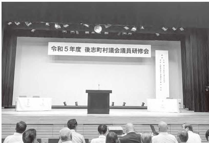
毎年テーマを決めて開催されています

1995年、全国町村議会議長会議事調査部採用。総務部、政務部、共済会業務部、総務部副部長、企画調整部副部長等を経て、2020年、共済会業務部長。2021年に議事調査部長となり、町村議会の活性化及び議会制度の改善につながる調査・研究を担当するとともに、町村議会の議員報酬の在り方に関する研究に携わる。