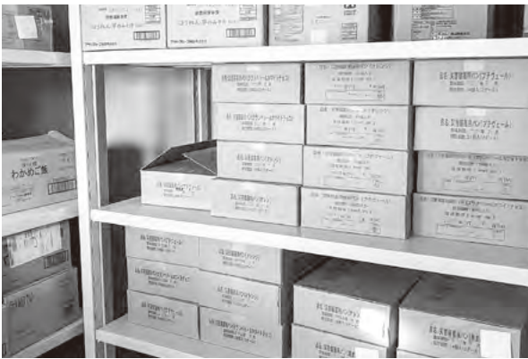
旧給食センター備蓄品

での管理となっています。旧給食センターから各避難所へお届けする計画ですが、分散して補充しておくべきというご意見も頭に入しながら対応しています。