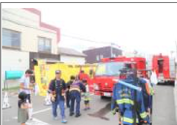
京極ふるさと祭りでのPR活動

総務省消防庁は、全国の消防団員数は4月1日時点で前年比1.9%減の73万2223人で過去最少を更新したと発表しました。