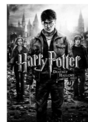
(c) 2011 Warner Bros. Ent. Harry Potter Publishing Rights (c) J.K.R. Harry Potter characters, names and related indicia are trademarks of and (c) Warner Bros. Ent. All Rights Reserved.